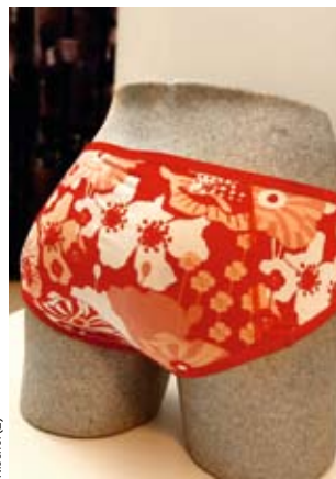
Der letzte Schrei in Schweden: Unterwäsche von Björn Borg.

Wien Alsergrund. Mobiliar, qualitativ hochstehende Teppiche und Lampen im reduziert funktionellen Schweden-Design gibt es seit neuestem in der Wiener Sechsschimmelgasse. Der Showroom/Shop von United Scandinavia Interior birgt nebenbei noch Überraschendes: Herrenunterwäsche von Björn Borg.