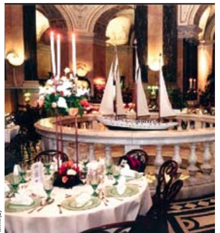
In der Kuppelhalle des Naturhistorischen Museums wird das Muscheldinner serviert.